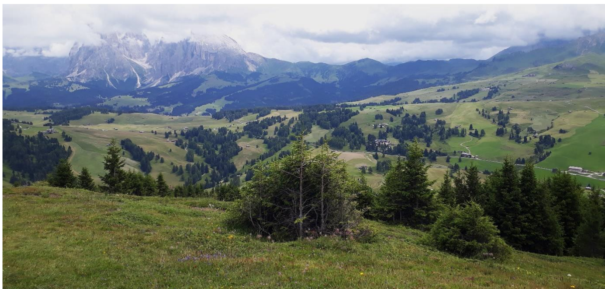
Panorama wandeling Seiser Alm

Het vervolg hebben we ondertussen aan den lijve ondervonden. Elke dag sloot naadloos aan bij de vorige. Het genieten ging crescendo. Elke avond een up-date van het volgende dagprogramma. We werden geleid naar stadjes als Brixen, Caprino Veronese, Kaselruh, Bolzano, Klause...naar almen zoals Seiser – de grootste bergweide van Europa, Mesmer, en vele andere, hetzij te voet, met de bus, met het oude treintje of met de gondels.